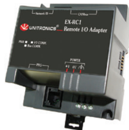
I/O sovitin hajautukseen