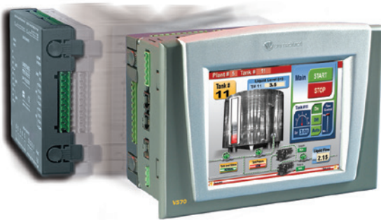
SNAP-IN I/O Vision ala-asemaan