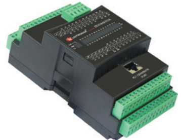
I/O yksikkö hajautukseen