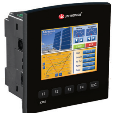
V350-S 3,5" (-30°C....+60°C)